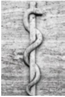
Had na kůlu

Všichni, kteří pohlédli na hada na kůlu, byli uzdraveni.