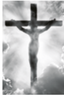
Kristus na kříži

Všichni, kteří pohlédli na hada na kůlu, byli uzdraveni.