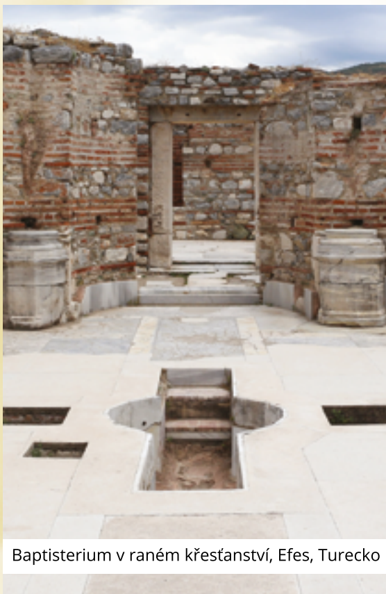
Baptisterium v raném křesťanství, Efes, Turecko

z mrtvých, vstoupili na cestu nového života. Neboť jestliže jsme se stali s ním srostlými tím, že jsme mu byli podobni ve smrti, jistě mu budeme podobni i v zmrtvýchvstání. Římanům 6:3-5